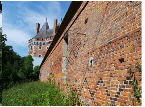
Le mur extérieur des communs