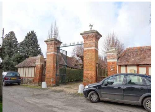
Constructions dans le bourg centre