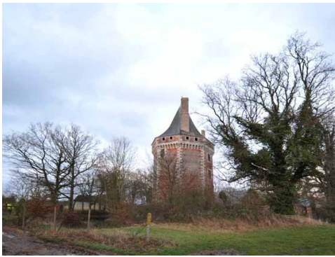
La tour de Thevray