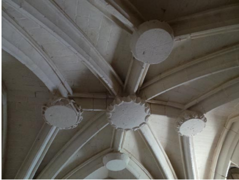
Vue des plafonds intérieur